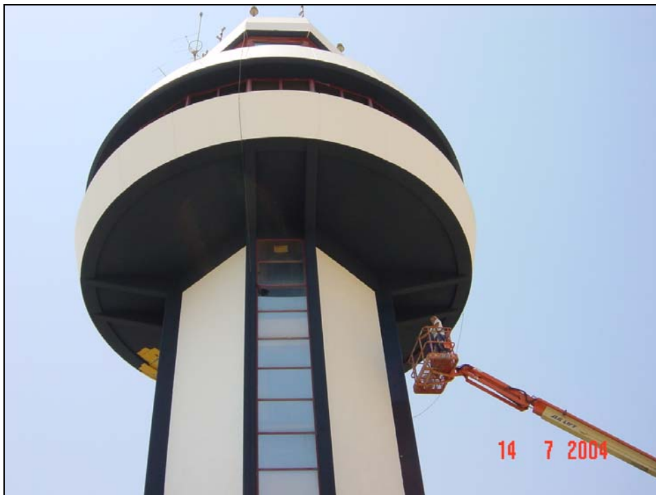
Momento del tratamiento con ayuda de plataforma articulada.