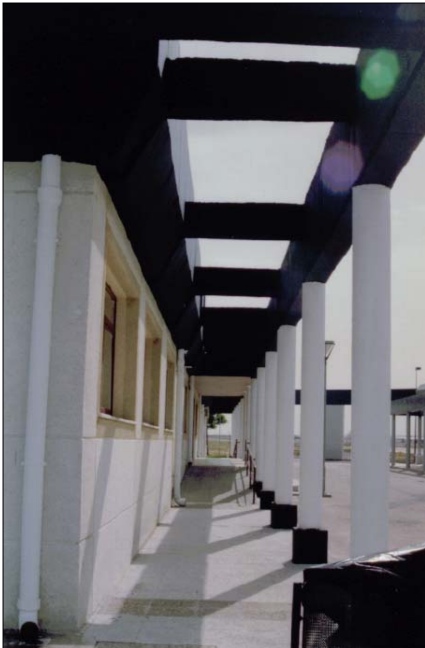
Estado final de los pilares del edificio anexo a la torre de control una vez recubiertos con Q-2100.