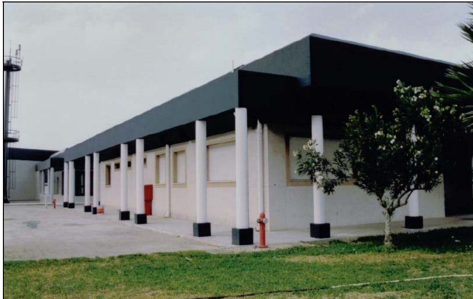
Estado final de Jácenas y paramentos.