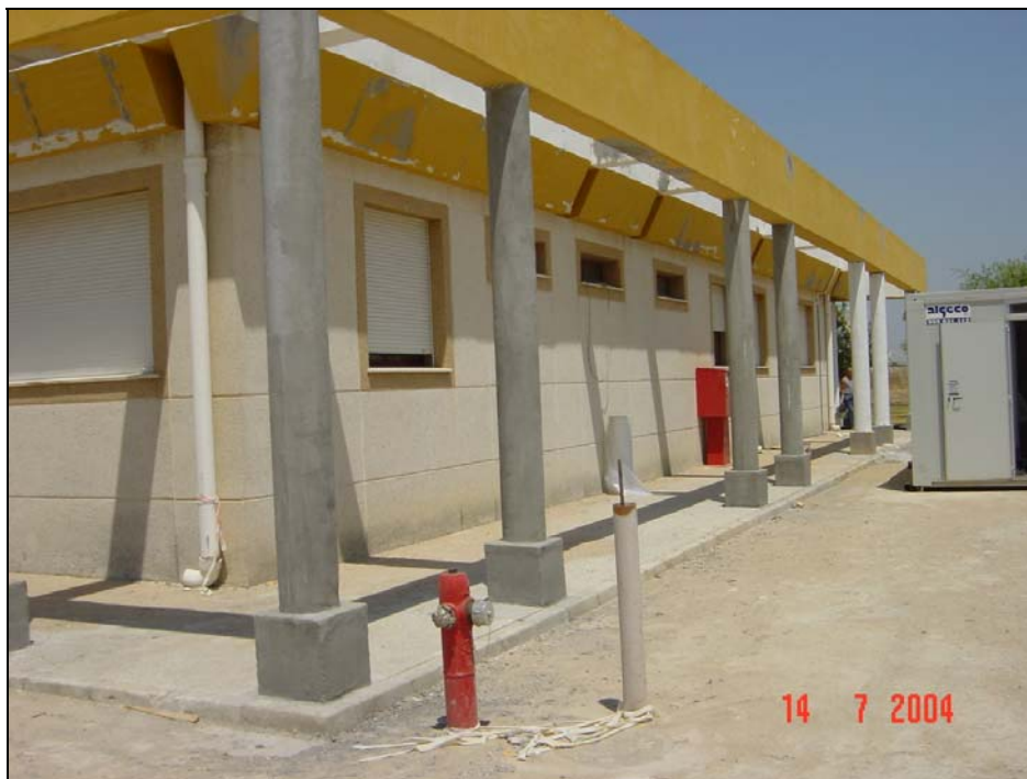
Aspecto tras la reparación.

1º.- Aplicación de la lechada pasivante Q-2023 sobre la armadura metálica en las zonas ya limpias, este producto es una lechada pasivante que se puede añadir con brocha con un espesor entre 1 y 2 mm lo más rápidamente posible desde el paso de limpieza de óxido anterior.