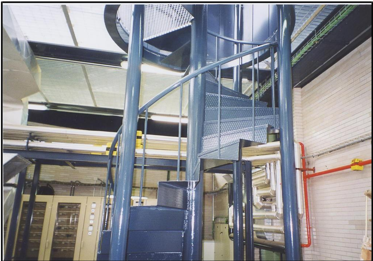
Aspecto final del tramo inicial de la Torre de Antenas tras la aplicación del recubrimiento VpCI-386 transparente y el recubrimiento en color azul.

Una tercera línea de actuación es la llevada a cabo sobre la estructura metálica correspondiente a la Torre de Antenas, el mecanismo realizado se ha basado en la aplicación del recubrimiento VpCI-386 y un recubrimiento específico para exteriores del mismo color que el inicial con el fin de establecer una restauración y mejora de toda la estructura metálica.